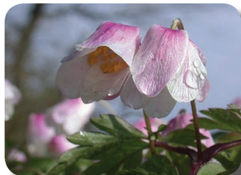
Hvid Anemone.

Vi har et tæt samarbejde med de andre nordiske botaniske foreninger for at fremme interessen for den vilde flora på nordisk plan.