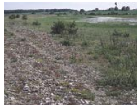
Langemose bag strandvold med Strand-Storkenæb. 29. maj 2005.