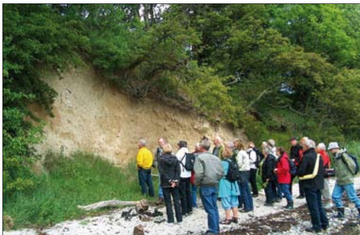
Tur til Sondrup Strand.

Succesen for De Vilde Blomsters Dag i Norden er meget afhængig af, hvordan det lykkes at