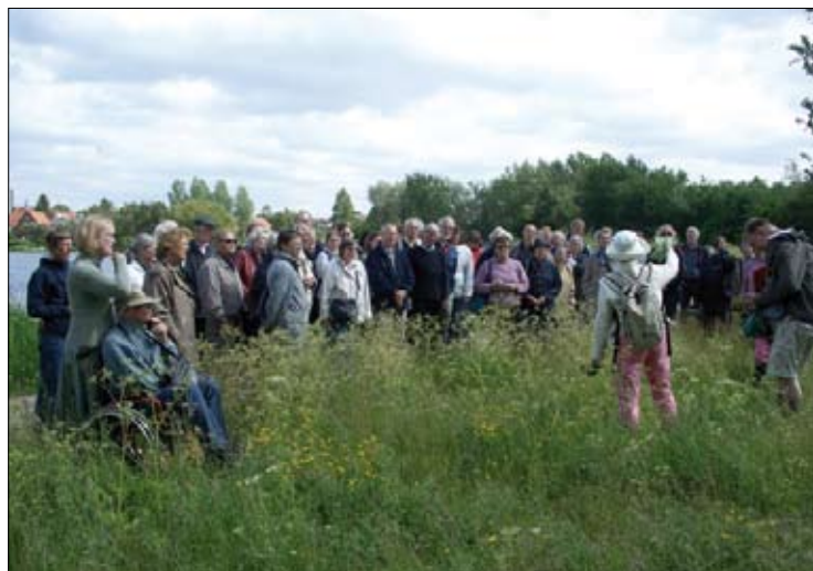
Tur til Gentofte Sø.

Fra den 20. – 23. august mødtes repræsentanter for Norsk-, Svensk- og Dansk Botanisk Forening på øen Stord i skærgården i Vestnorge bl.a. for at evaluere årets arrangement og koordinere det fremtidige samarbejde mellem foreningerne. Et samarbejde alle ønskede at fortsætte og udbygge. Vi arbejder bl.a. på, at der til næste år kan uddeles en folder til alle deltagere med titlen: ”150 almindelige danske arter”. I den vil der være foto og kort tekst om planterne og mulighed for at krydsede af, hvilke planter man har fundet på De Vilde Blomsters Dag samt på efterfølgende private ture. På mødet besluttedes det, at De Vilde Blomsters Dag i Norden 2010 bliver søndag den 20. juni . Reserver allerede nu dagen. I 2011 bliver dagen søndag den 19. juni.