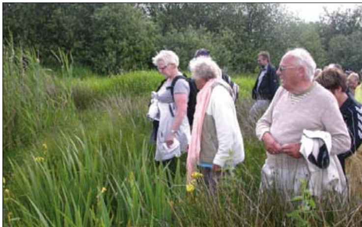
Tur til Feldmose ved Jelling.

få turene omtalt i medierne. No- gle år går det fint og andre min- dre godt. 2009 var ingen undta- gelse, men adskillige turledere har meldt om god pressedæk- ning.