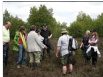
Tur til Haslund Krat.