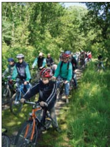
Tur til Egholm med cykel.

ler mindre traditionelle botaniske ture, hvor man fra mødestedet bevæger sig rundt på lokaliteten og undervejs hører om de planter, som man møder. Hvad hedder de? Bestøvningsforhold, er de giftige, spiselige, tidligere og nuværende anvendelse, naturpleje og meget mere.